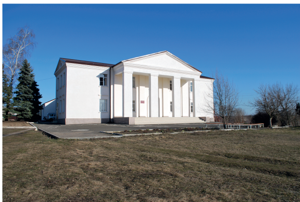
Пример правильного существующего цветового решения

Рекомендации по колористическому решению фасадов прилегающей территории